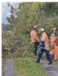
Auch ein Waldrand lässt sich naturnah gestalten, erfahren die Teilnehmer des Landschaftspflegekurses in Geestenseth. Entfernt man große Bäume, bekommen Sträucher und Kräuter darunter mehr Licht und der Artenreichtum dieses Landschaftselementes nimmt zu.

gestenreich erklärt er das den Kursteilnehmern draußen vor der vergreisten Hecke. „Oben licht, unten dicht“, diesen Satz lässt er